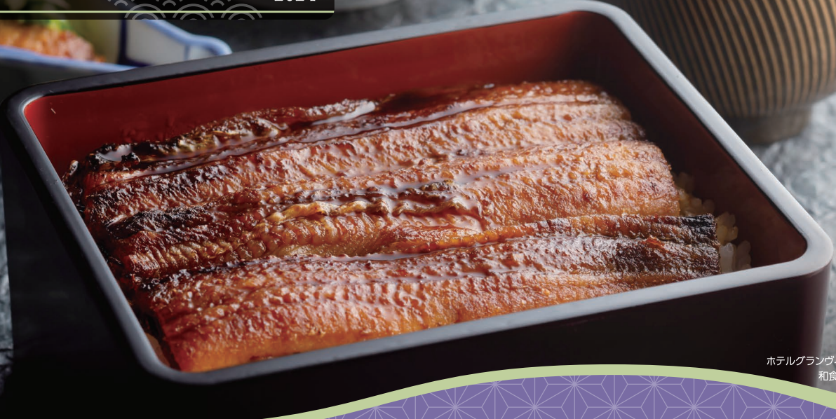
ホテルグランヴィア京都 和食「浮橋」