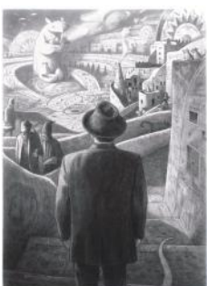
「アライバル」(部分)2004~2006年

オーストラリアの作家、ショーン・タン(1974~)は1999年に刊行した初めての絵本『ロスト・シング』を元に2010年に短編アニメーション映画を発表し、アカデミー賞の短編部門の賞を受賞しました。2006年に発表した文字のないグラフィック・ノベル『アライバル』は、大きな反響を呼び、23の言語で刊行されています。日本でも、その独自の世界観と表現方法で熱狂的なファンを獲得しました。本展は、タンの全面的な協力のもとに開催される大規模な個展となります。最初の絵本から最新作まで、彼の緻密で壮大な創作の秘密を解き明かします。