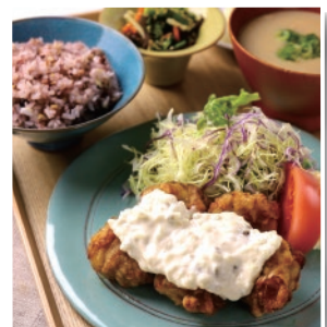
「唐揚げプレート」1,300円(税込) ソースはお好みで梅肉と南蛮からお選び頂けます。

「いちごやま」をはじめ、パフェが大人気のFukunaga901です。11:00~14:00のお時間は特別にランチメニューも数種類をご用意しています。Fukunaga901のランチはメインのお料理におぼんざい、サラダ、白みそのお味噌汁などが付いたプレートスタイルです。ごはんは十六穀米を使用しています。お昼はしっかり食べたい、おひとり様ランチが好きな方、是非一度ご来店くださいませ。