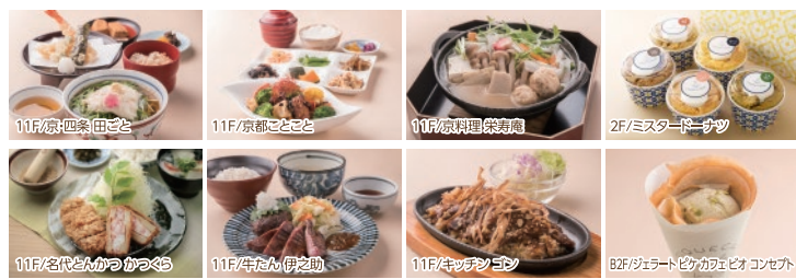
11F/名だんかつ 11F/牛たん(伊之助) 11F/チヂメ 11F/京都 錦わらい 11F/八丁味處 串の坊 11F/先斗丸 B2F/ヴィド・フランス