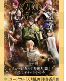
ミュージカル『刀剣乱舞』～三百年の子守唄～