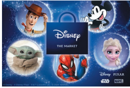
© Disney © Disney/Pixar © &TM Lucasfilm Ltd. © 2024 MARVEL

今回のイベントでは、「魔法」がテーマの新商品を中心に、三越伊勢丹限定商品やイベント限定商品を多く取り揃えました。さらにプレゼントやフォトスポットなど、盛りだくさんの内容でお届けします。ディズニー、ピクサー、マーベル、スター・ウォーズなどの愛されるキャラクターたちのアイテムが一堂に会する特別なイベントをお楽しみください。