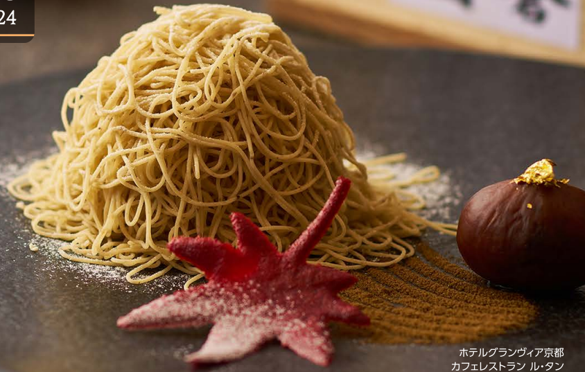
ホテルグランヴィア京都 カフェレストラン ル・タン スイーツバイキングのシェフの一皿