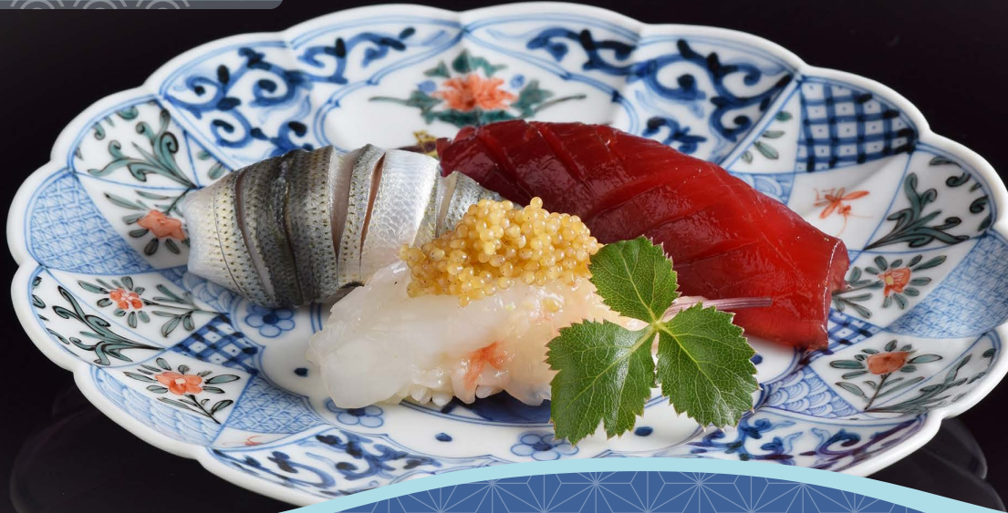
京都ポルタ11Fポルタスカイダイニング 金沢まいもん寿司 珠姫