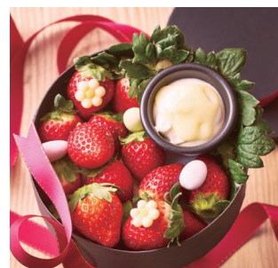
「京都産苺ボックス」 写真はすべてイメージです