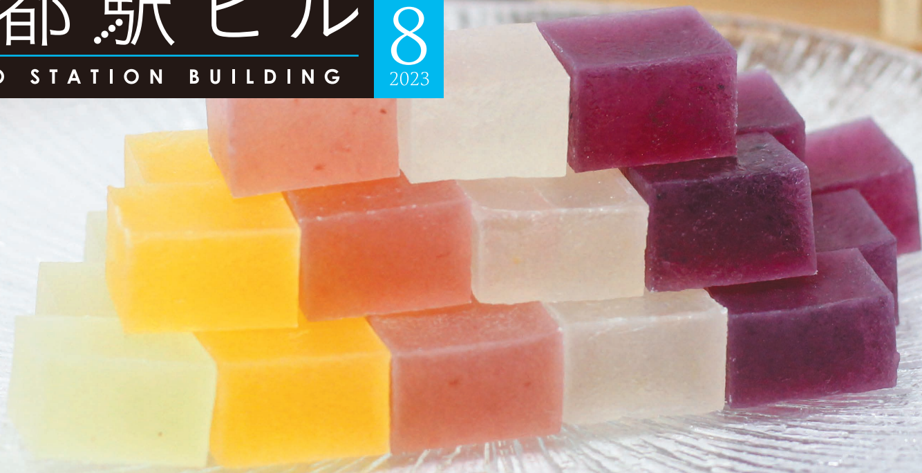
京都・柱 鶴屋光信(和菓子) 食べる宝石 琥珀糖