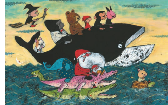
「いるがうまれるものがたり」2023年 ©TOMONORI TANIGUCHI