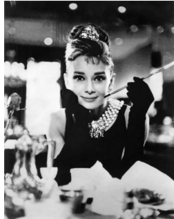
「ティファニーで朝食を(1961)」より mptvimages.com

2023年4月1日(土)～5月14日(日) 会期中無休 女優、オードリー・ヘプバーン(1920-1993 ベルギー生まれ)がこの世を去ってから30年。『ローマの休日』のプリンセス役から一躍スターの道を歩んだ彼女は、今もなお多くのファンをあこがれの的。本展では、彼女が出演した映画をテーマに、著名な写真家の作品を含む約120点の写真を展覧します。