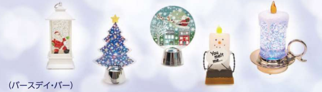
(パースデイ・バー)

クリスマスシーズンをおしゃれに彩るアイテム、大集合。 期間限定品も種類豊富にご用意! 詳しくは館内のイベントチラシでチェック