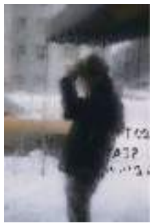
《帽子》1960年頃 ソール・ライター財団蔵

アメリカ・ペンシルバニア州に生まれたソール・ライター(1923-2013)は、1950年代からニューヨークで第一線のファッション・フォトグラファーとして活躍していましたが、1981年、5番街にあったスタジオを閉鎖し、表舞台から姿を消しました。しかし、2006年、ドイツのシュタイデル社から出版された初の写真集『Early Color』が大きな反響を呼び、各国で次々に展覧会が開催されるようになり、再び脚光を浴びることになったのです。天性の色彩感覚によって「カラー写真のバイオニア」と呼ばれた個性と才能は、彼が亡くなった今も生き続けます。本展では、2014年に創設されたソール・ライター財団が管理する膨大な作品資料のアーカイブから、選り抜かれた作品を展覧します。